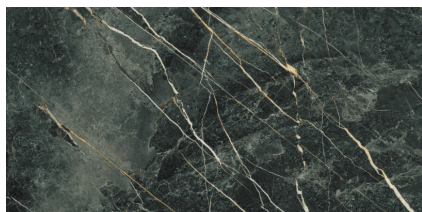
WACOM MOSS PULIDO P6012GRP