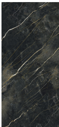
WACOM FOREST PULIDO BP2612RP