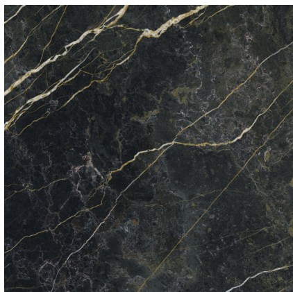
WACOM FOREST PULIDO P1212GRP