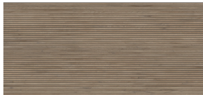
STRIPES VERMONT WALNUT BP2612R