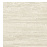
VENICE BEIGE NATURAL P1212LB