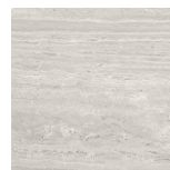
VENICE GRIGIO PULIDO P1212P