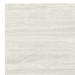
VENICE BIANCO PULIDO P1212P