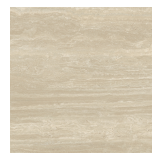
VENICE MIELE PULIDO P1212P