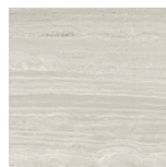
VENICE GRIGIO NATURAL P1212LB