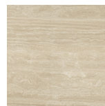
VENICE MIELE NATURAL P1212LB