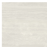
VENICE BIANCO NATURAL P1212LB