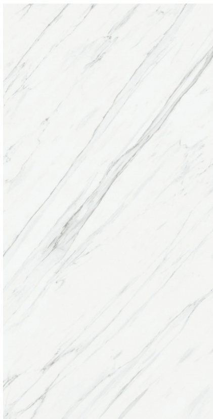
VANGLIH P PULIDO BP2412V