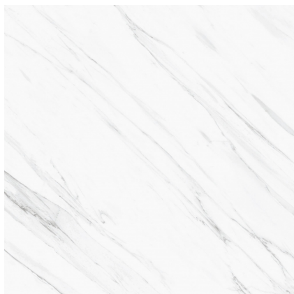
VANGLIH PULIDO P1212V