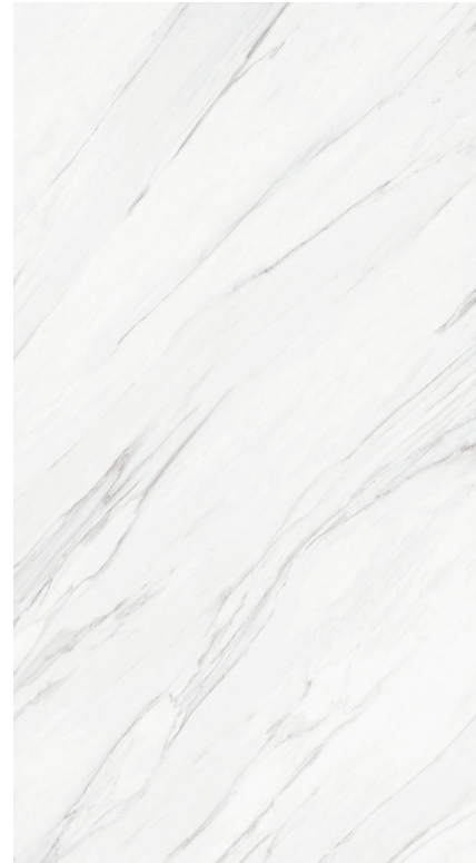
VANGLIH P NATURAL BP2412L