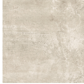
URBAN TAUPE PR6060L