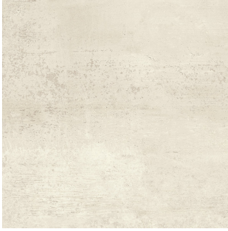
URBAN IVORY PR6060L