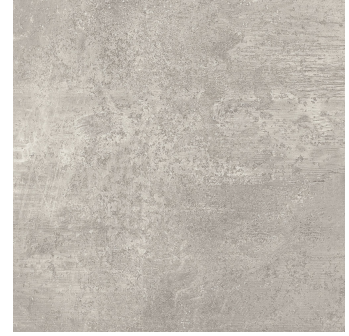
URBAN GREY PR6060L