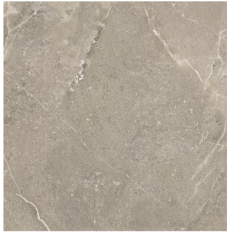
URAL NATURAL ANTI-SLIP PR6060R