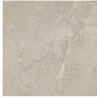
URAL BONE ANTI-SLIP PR6060R