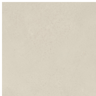
UNIK IVORY ANTI-SLIP PR6060R