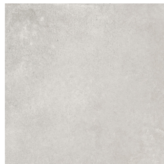
UNIK ASH ANTI-SLIP PR6060R