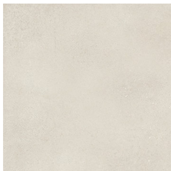
UNIK IVORY NATURAL PR6060L