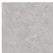
STONELAND PEARL ANTI-SLIP PR6060RB