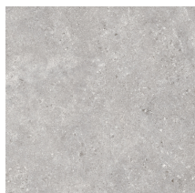
STONELAND PEARL PR6060LB