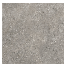
STONELAND GREY PR6060LB