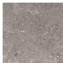
STONELAND GREY ANTI-SLIP PR6060RB