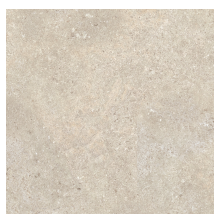
STONELAND IVORY ANTI-SLIP PR6060RB