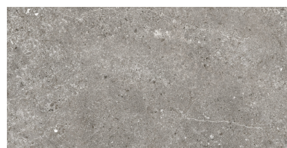
STONELAND GREY PR3060LB