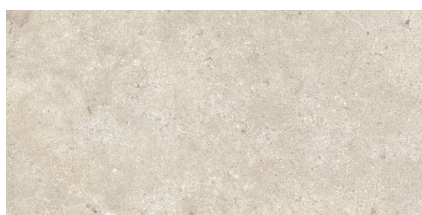
STONELAND IVORY PR3060LB