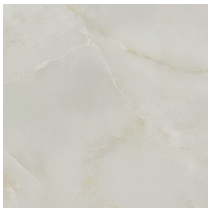
QUIOS SILVER PULIDO PR8080P