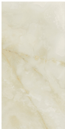
QUIOS CREAM PULIDO P6012P