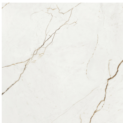
QUANTUM PULIDO PR6060P