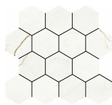
HEXA QUANTUM NATURAL