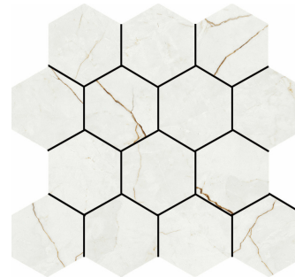
HEXA QUANTUM PULIDO TR-45