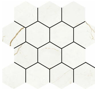
HEXA QUANTUM NATURAL TR-42