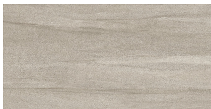
PROSPECT NATURAL P6012R