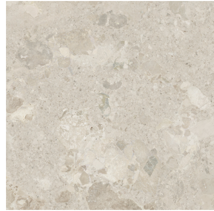
POSITANO AVORIO ANTI-SLIP P1212RB