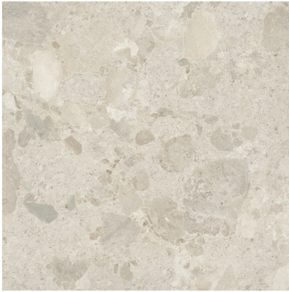
POSITANO AVORIO P1212RB