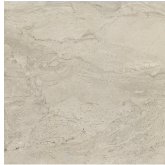
PIENZA AVORIO PULIDO PR8080P