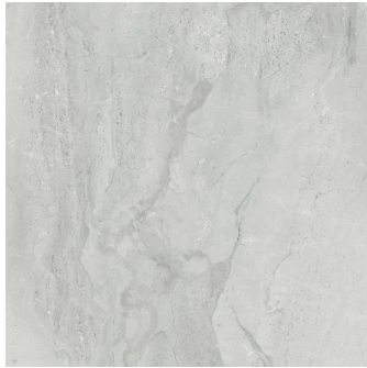
PIENZA CENERE PULIDO PR8080P