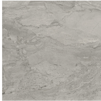
PIENZA GRIGIO PULIDO PR8080P