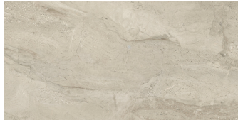
PIENZA AVORIO PULIDO P6012P