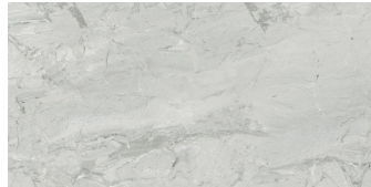
PIENZA CENERE PULIDO P6012P