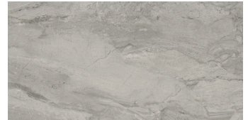
PIENZA GRIGIO PULIDO P6012P