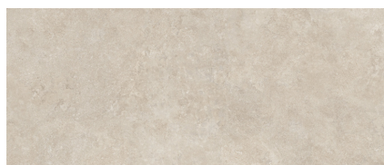
ORION BEIGE BP2812RB