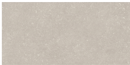
NOTTING NUT P6012RB