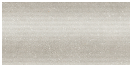
NOTTING GREY P6012RB