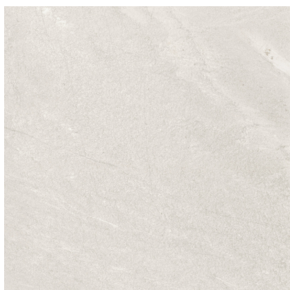
NATURE ASH PR6060LB