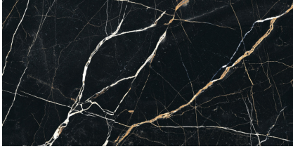
MOONLIGHT PULIDO P6012GRP