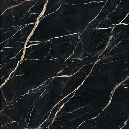
MOONLIGHT PULIDO P1212GRP