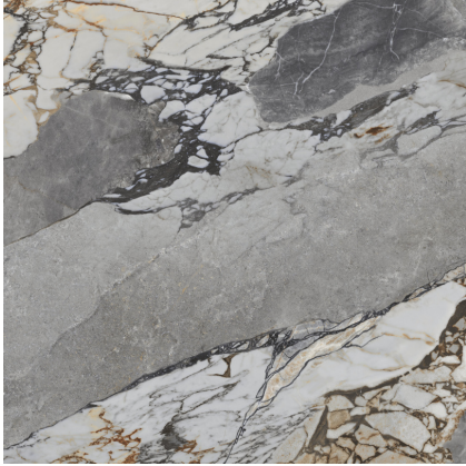
MINERAL STONE NATURAL P1212RB