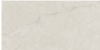
KRONOS SAND P6012R