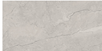
KRONOS TAUPE P6012R