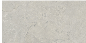
KRONOS SILVER P6012R