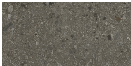
HANNOVER BLACK P6012R