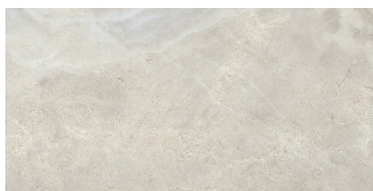
HAMPTON PULIDO BT6012P