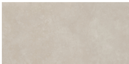
GINZA NUT P6012LB