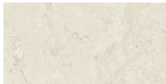
FLORENCE BEIGE P6012LB