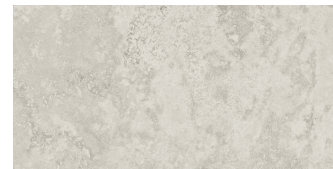
FLORENCE GRIGIO P6012LB