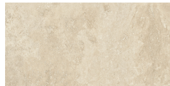
FLORENCE MIELE P6012LB