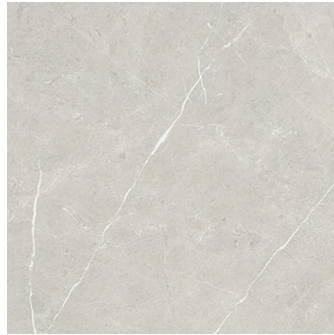
ETERNAL PEARL NATURAL PR6060L