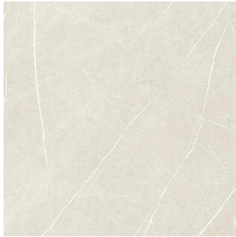
ETERNAL CREAM NATURAL RECTIFICADO PR6060L