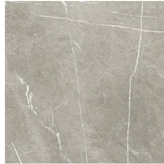
ETERNAL TAUPE NATURAL PR6060L