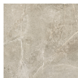
DOME NUT PR6060L