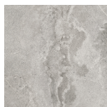
DOME ASH PR6060L