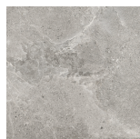
DOME ASH ANTI-SLIP PR6060R