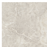
DOME BONE PR6060L