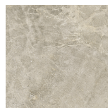
DOME NUT ANTI-SLIP PR6060R