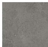
DOME ANTHRACITE PR6060R