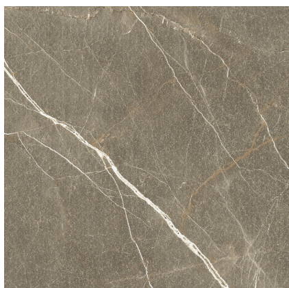
DAVENPORT NOCE F4545LB