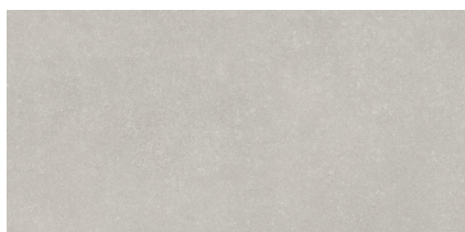
BRERA GREY P8016LB