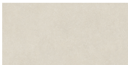
BRERA SAND P8016LB