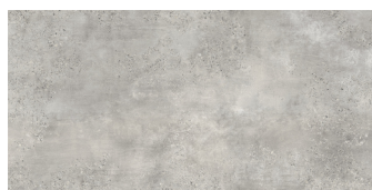
CAPITAL PERLA P8016L