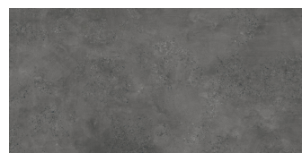
CAPITAL MARENGO P8016E