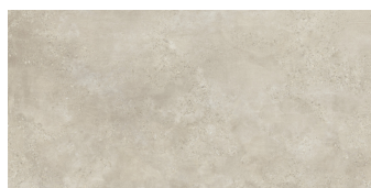
CAPITAL BEIGE RECTIFICADO P8016L