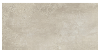
CAPITAL BEIGE P6012L