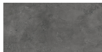
CAPITAL MARENGO P6012E