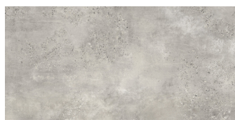
CAPITAL PERLA P6012L