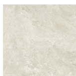
CANYON BONE PR8080RB