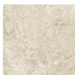
CANYON BEIGE PR8080RB