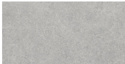
BRUNSWICH ACERO P8016R