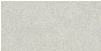
BRUNSWICH CENIZA P6012L