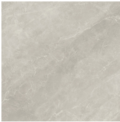
BALMORAL MOON NATURAL PR8080R