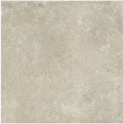
ZERMATT NATURAL PR8080LB