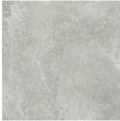
ZERMATT ACERO PR8080LB