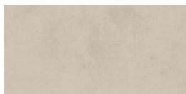
VILLAGE SOFT SABLE P8016RB