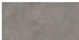
VILLAGE SOFT FONCE P8016RB