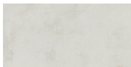
VILLAGE SOFT BLANC RECTIFICADO P8016RB