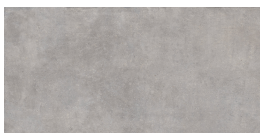
VILLAGE SOFT CENDRE P8016RB