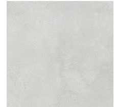
UNIK ASH ESPESORADO RECT. ANTI-SLIP PR8080BES