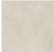
UNIK IVORY ANTI-SLIP PR8080R