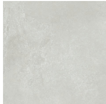
UNIK ASH NATURAL PR8080L