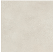
UNIK IVORY NATURAL PR8080L