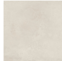
UNIK IVORY ESPESORADO RECT. ANTI-SLIP PR8080BES