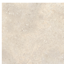
STONELAND IVORY ANTI-SLIP PR6060RB