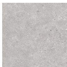
STONELAND PEARL ANTI-SLIP PR6060RB