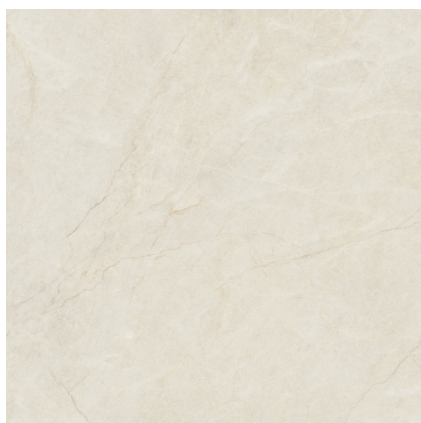
SORRENTO SABBIA NATURAL RECTIFICADO PR8080R