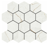
HEXA QUANTUM PULIDO