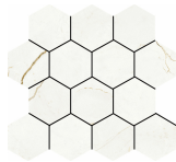
HEXA QUANTUM NATURAL