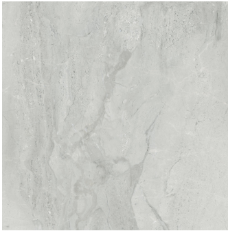
PIENZA CENERE PULIDO PR8080P